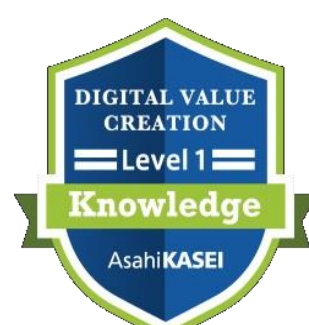
旭化成DX OpenBadge プログラム