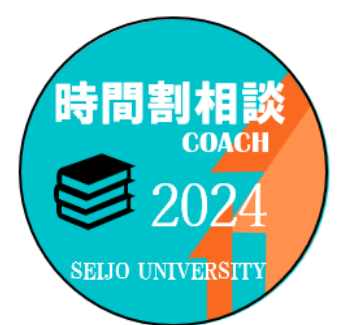
成城大学 ピアサポーター 時間割相談2024