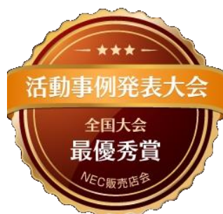
NEC販売店会 活動事例発表大会 全国大会 最優秀賞