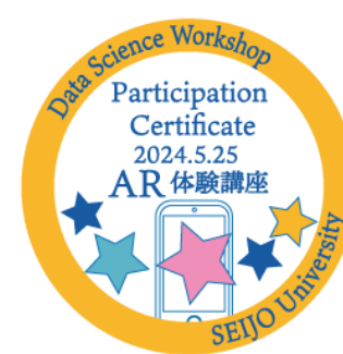
成城大学 データサイエンス ワークショップ